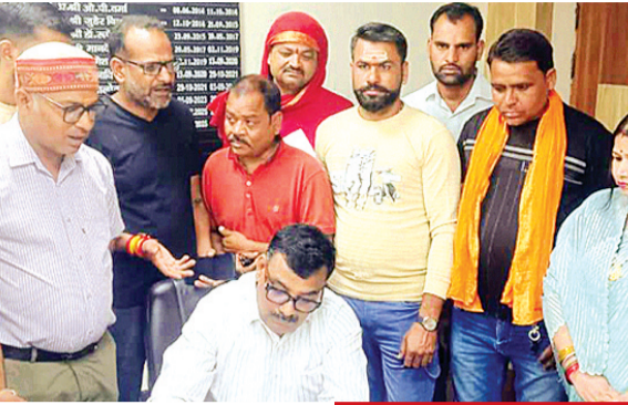
हरिभूमि न्यूज़ ललितपुर

जितनी सुविधा नहीं है उससे ज्यादा उन व्यवस्थाओं के नाम पर फीस वसूली जाती है